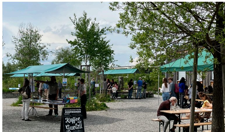
Von oben: Impressionen aus den BirdLife-Naturzentren Klingnauer Stausee und La Sauge und vom Frühlingsmarkt des Naturzentrums Pfäffikersee.