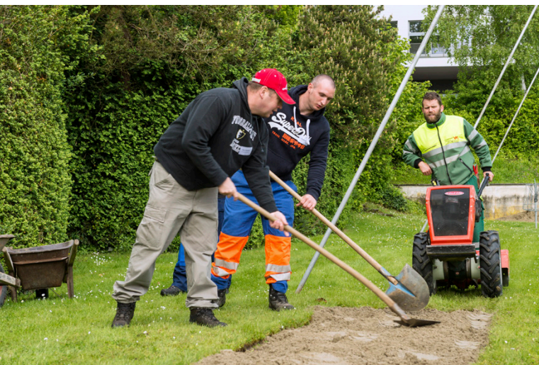
Auf kommunaler Ebene und auf Grünflächen von Institutionen ist für Aufwertungen viel Potenzial vorhanden.

ist, ist der Tierlibaum eine wichtige Nektarpflanze. Auch viele andere gezüchtete Zierpflanzen haben keine ökologische Funktion mehr und produzieren oft nicht einmal mehr Nektar. Invasive Neophyten wie der Sommerlieder (Buddleja) oder der Kirschlorbeer breiten sich unkontrolliert aus. Also, nicht-einheimische durch heimische Pflanzen ersetzen heisst die Devise.