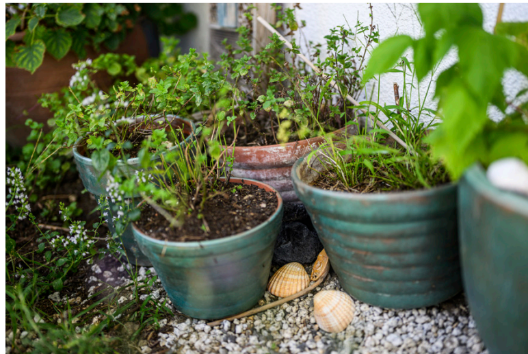
Auch auf dem Pausenplatz oder vor dem Haus ist mehr Natur möglich.